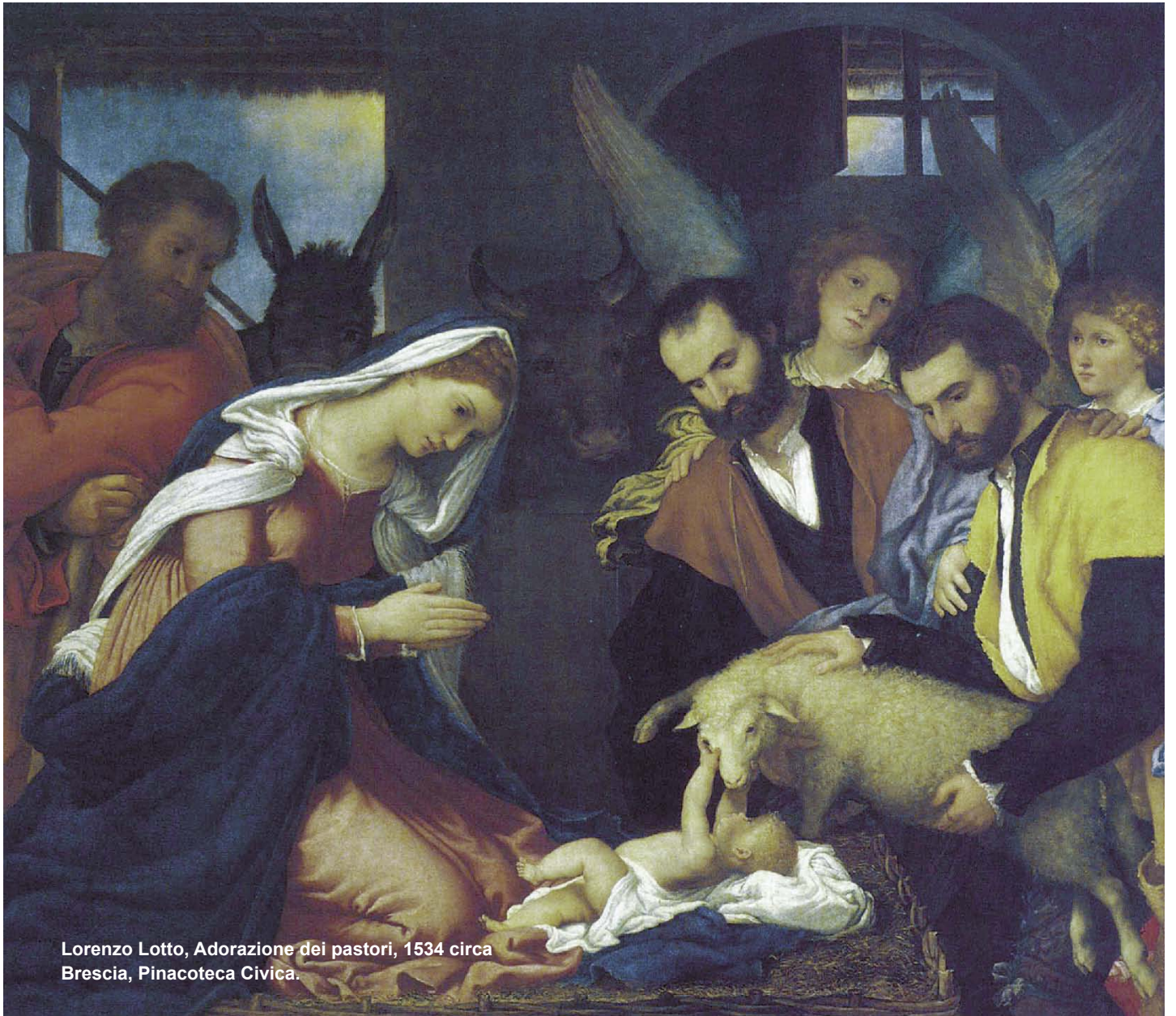
Lorenzo Lotto, Adorazione dei pastori, 1534 circa Brescia, Pinacoteca Civica.